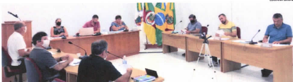
Sessão realizada na segunda-feira